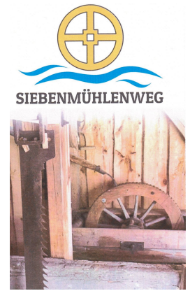
Titelblatt Info-Folder des Projektes 7-Mühlen-Weg. Eröffnung 2021

Gemeindehauses zu einem richtigen Gesundheitszentrum entwickelt. Das Einzige was nicht so gesund in diesem Haus ist sind die Gemeindefinanzen. Bedingt durch die SARS II Covid 19 Pandemie sind die Einnahmen aus den Ertragsanteilen entsprechend gesunken, gewisse Pflicht-Ausgaben wie Sozialhilfverbandsumlage, Krankenanstaltenbeiträge, etc. sind aber gestiegen. Zusätzliche Kosten haben die Sanierung des Hauptsammlers beim Ortskanal, der Umbau im Amtsgebäude